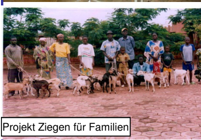
Projekt Ziegen für Familien