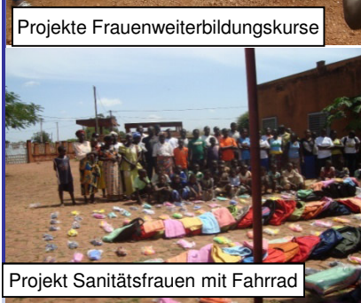
Projekt Sanitätsfrauen mit Fahrrad