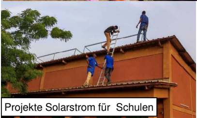
Projekte Solarstrom für Schulen