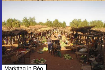
Markttag in Réo