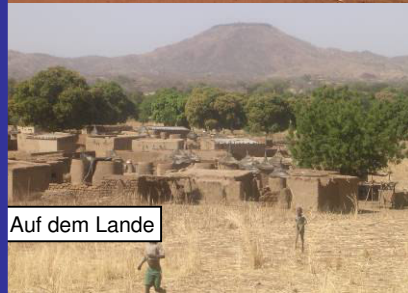
Auf dem Lande