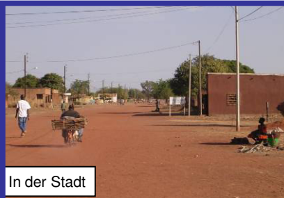
In der Stadt